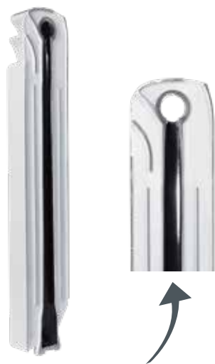
Внутренняя обработка Aleternum® компании Fondital

Коррозия – это основная причина повреждений отопительной системы. Со временем находящаяся в контакте с водой поверхность металла подвергается разрушительному действию коррозии и приводит к значительному снижению эффективности системы с одновременным увеличением затрат. Например, коррозия в системе, состоящей из стальных или чугунных радиаторов, приводит к появлению отложений на дне радиатора, которые засоряют трубы и сами радиаторы, что приводит к частичному либо полному снижению теплоотдачи и перепадам в распределении тепла. В обычных алюминиевых радиаторах коррозия приводит к образованию газовых скоплений (воздушные пробки), которые не позволяют радиатору разогреться равномерно и могут снизить его теплоотдачу. Во избежание появления коррозии компания Fondital изобрела Aleternum®: эксклюзивную обработку внутренней поверхности радиатора на основе смолы для защиты его водяной камеры. Радиаторы Fondital с обработкой Aleternum® представляют собой новую эру тотальной защиты и являются синонимом безопасности и высоких показателей теплоотдачи. Ваша система отопления всегда будет как новая!