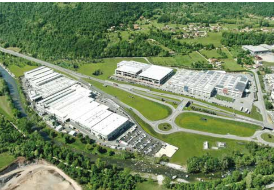
Производственные площадки Fondital Spa в г. Карпенедиа ди Вобарно (Брешиа, Италия)